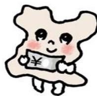
盛岡市広報キャラクター「モリオイ」