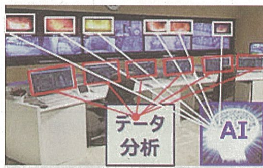
「BRA-ING」による自動運転イメージ