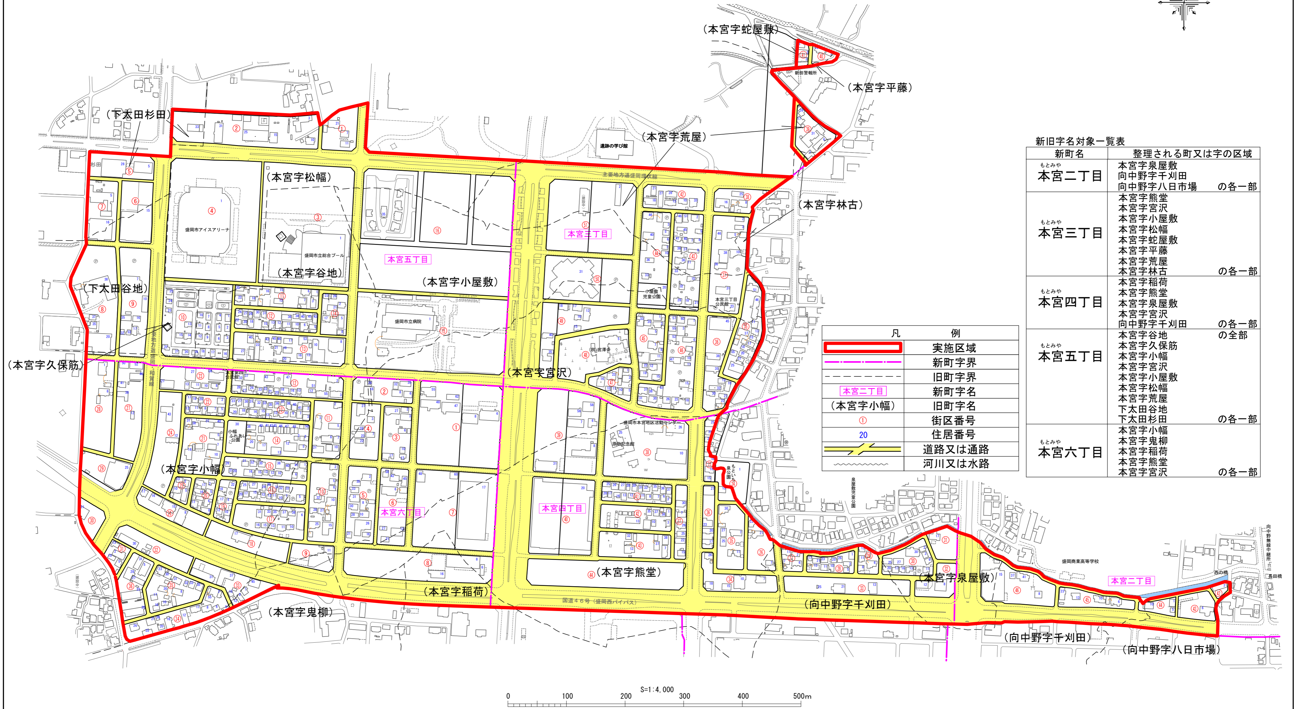
新旧字名対象一覧表