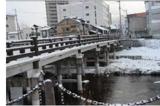
中津川 上ノ橋周辺に四季