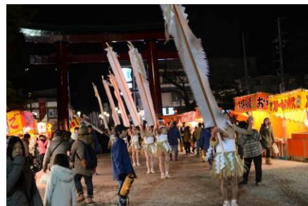
八幡宮のお年とり裸参り（1月15日）