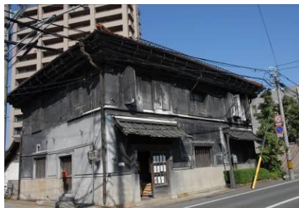
旧井弥商店（盛岡正食普及会）