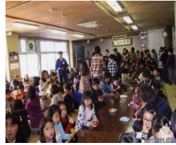
三世代交流 餅つき大会