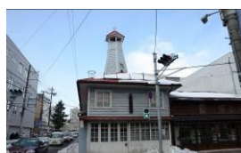
旧消防第五分団屯所