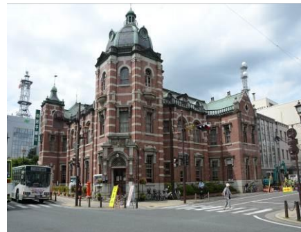
旧盛岡銀行本店 （前岩手銀行中ノ橋支店）