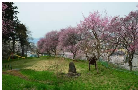
天満宮の啄木の歌碑と梅林