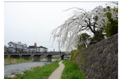
上ノ橋の桜とカキツバタ