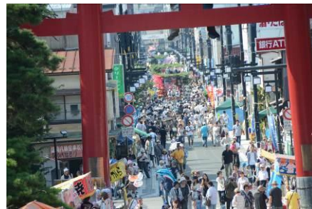
八幡宮の秋祭り（9月15日）