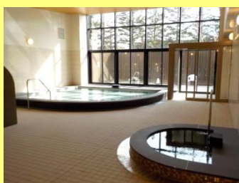
「ふなばしメグロスパ」