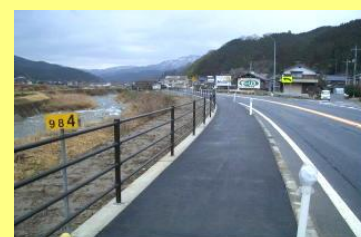
歩道やガードレールの整備