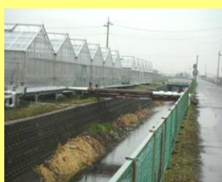
「足利市南部クリーンセンター」