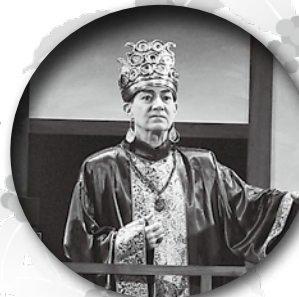
キャンベルさんは、時代物で大王役を熱演!