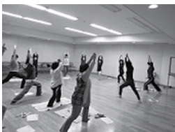
「働く女性のここからだ講座」の様子

男女共同参画の視点で、暮らしや地域に役立つ講座や女性の心と体の問題に関する講座、男性や親子対象の講座など、幅広い世代の人が参加できる講座を実施。講座のお知らせは、広報もりおかなどに掲載しています。