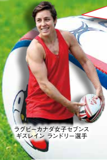
ラグビーカナダ女子セブンス ギスレイン ランドリー選手

ラグビーカナダ女子は前回のリオデジャネイロオリンピックで銅メダルに輝くなど、今回のTokyo2020でもメダル候補の強豪です。チームの特徴や得意なプレー、盛岡への思いなどを選手に聞きました。