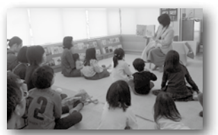
表 子ども科学館の各種イベント