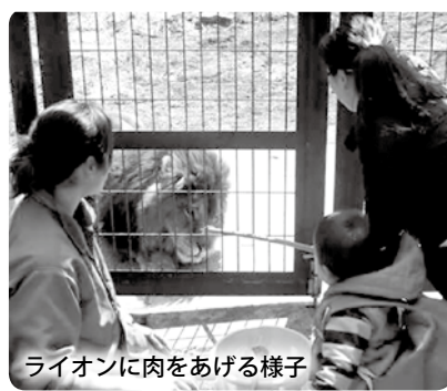
ライオンに肉をあげる様子