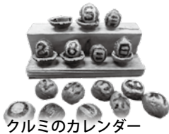
クルミのカレンダー