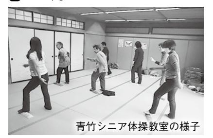
青竹シニア体操教室の様子

つどいの森で健康づくり 都南老人福祉センター ☎638-1122 📍 同福祉センター（湯沢1） 👤 20人※60歳以上 📞 電話：12月18日(火)10時から ▶ ヨガ教室 肩こりや腰痛、冷え症をヨガで改善。 🕒 1月10日(木)10時半～11時半 💰 500円 ▶ ピラテス体操教室 体幹を鍛え、しなやかな体を作る。 🕒 1月17日(木)10時半～11時半 💰 500円 ▶ 青竹シニア体操教室 青竹を使った体操で、内臓の血流をアップ。 🕒 1月24日(木)10時半～11時半 💰 500円