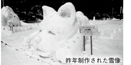
昨年制作された雪像

▶ 各種ボランティア 📍 はがきに住所と名前、電話番号、参加できる日時を記入し、☎020-8530(住所不要)市役所観光交流課へ郵送。ファクスでも受け付けます。1月28日(月)17時必着 ▶ スノーキャンドル制作 🕒 2月4日(月)～7日(木)、13時半～17時 ▶ 着火作業など 🕒 2月7日(木)～9日(土)、16時～20時半 ▶ 撤去作業 🕒 2月10日(日)10時～12時