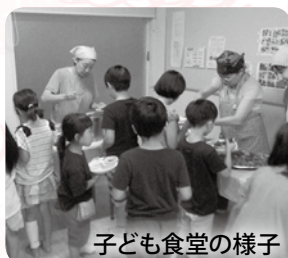
子ども食堂の様子

山岸地区の放課後児童クラブ施設を有効活用し、日曜日に子どもたちが過ごせる居場所づくりと子ども食堂による親子と地域の交流、子育て情報交換の場として子育てサロンの開設をしています。地域住民なども参加し、さまざまな関わり合いの中で子どもたちの成長を支えています。