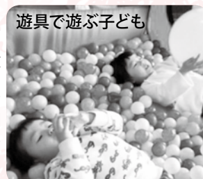
遊具で遊ぶ子ども

仁王地区活動センターなどに遊具を設置して、親子や子ども同士で遊べる場所も提供したり子育ての情報交換ができる交流会を開催したりしています。活動には地域の協力者「見守り隊」がいて、参加した親子とコミュニケーションを通じて育児の不安や悩みなどの相談にのっています。