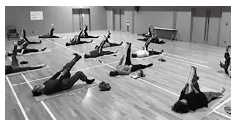
ジュニアサッカー教室の様子