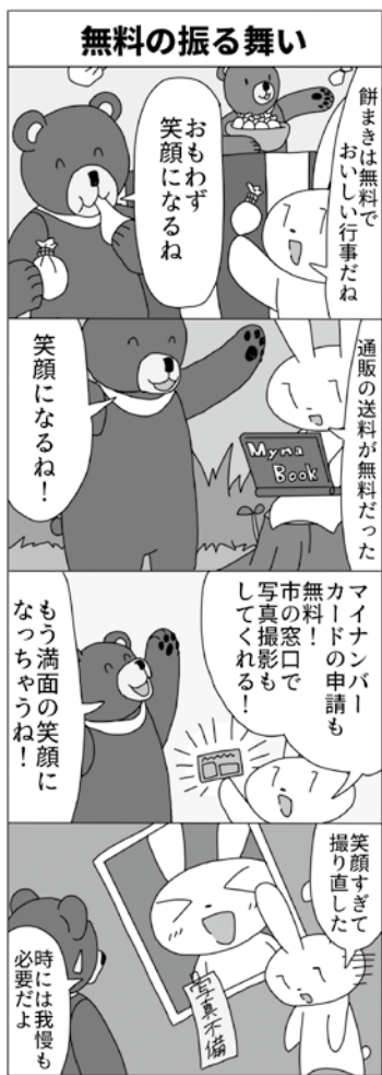
※顔写真は普通の表情で撮りましょう