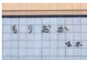
盛岡駅正面の壁にある「もりおか」は啄木自筆の文字を集字して作られた。

まちの真ん中にそびえるのは、盛岡城の高い石垣。盛岡城跡公園には石川啄木や新渡戸稲造、宮沢賢治など、盛岡ゆかりの人たちの碑があります。先人の技術が作り上げ、偉人たちが思いを馳せたこの場所は、いまも盛岡市民の憩いの場。桜や紅葉など、季節によって装いが変わり一年中楽しめます。下の橋で中津川を眺めつつ進むと、新渡戸稲造生誕の地、小さな公園の奥に、稲造の銅像がたたずんでいます。