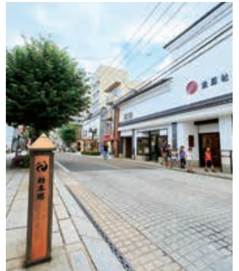
18 いーはとーぶアベニュー材木町 MAP C-3・B-3