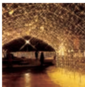
凍てつく冬もほっこり