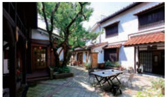
18 いーはとーぶアベニュー材木町 (光原社) MAP C-3

16.啄木新婚の家：歌集『一握の砂』で有名な石川啄木が、妻と家族と共に過ごした家。[施設データP12]