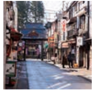
大人の迷子は ちょっと楽しい