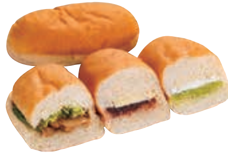
17 福田パン MAP C-2

代表的なあんバターのほか、 豊富なメニューがあり、組み 合わせは1,000通り以上。 あれもこれもと迷う盛岡の ソウルフード。