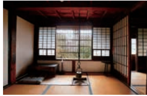
16 啄木新婚の家 MAP C-3