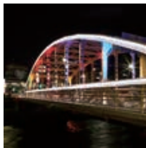
まちなかライトアップ