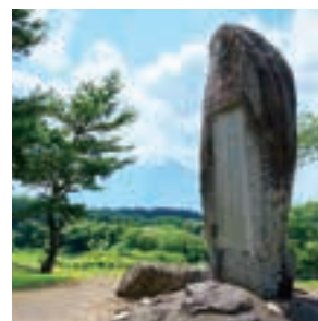
先人の地を訪ねる