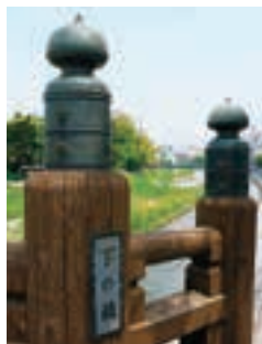
2 下の橋 MAP D-5

2.下の橋 ：現在の橋は明治 44年に架け替えられたもの。 擬宝珠は中の橋が洋式の橋 になることをきっかけに大 正元年に移設された。