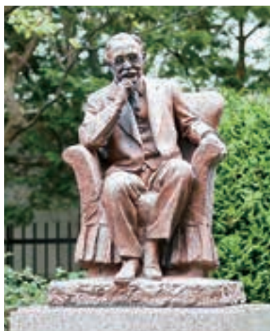
3 新渡戸稲造生誕の地 MAP D-5