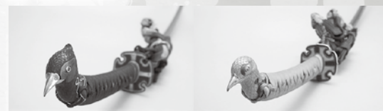
雉子頭雌雄御太刀拵(きじがしらしゅうおんたちこしらえ)