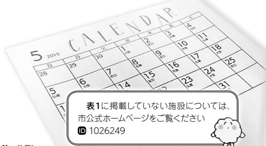
表1に掲載していない施設については、市公式ホームページをご覧ください ☎1026249

※他市町村の住民票などは取り扱いません。戸籍届(婚姻届など)は、原則受領のみの対応とし、内容確認などは5月7日以降に行います(当日は新元号の初日につき、混雑が予想されます)