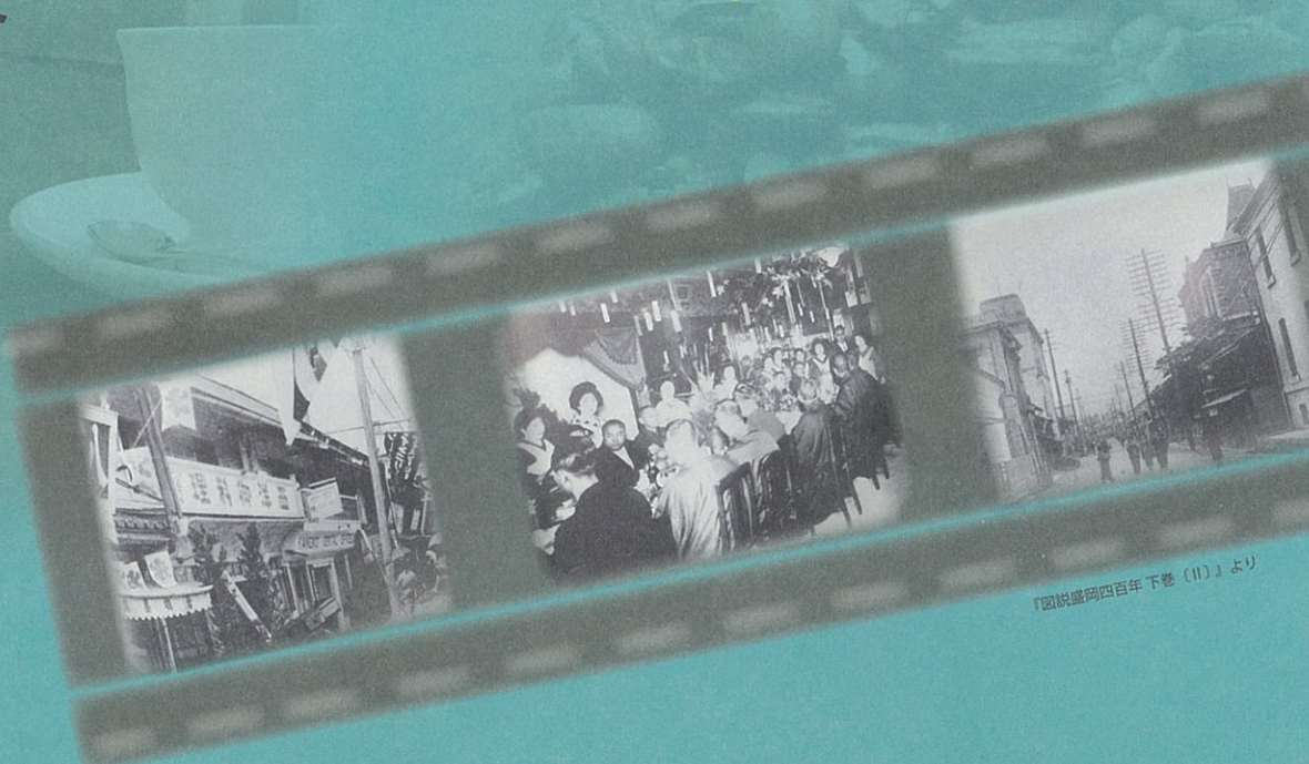
『図説盛岡四百年 下巻(11)』より

文明開化の波とともに押し寄せた西洋文化。モダンの代表格であり、文化の創造拠点でもあったのが、かつての「喫茶店」です。文士の社交場と呼ばれ、サロン文化の先駆けともなった東京の西洋料理店「メイゾン鴻乃巢」や、今に残る日本最古の喫茶店「カフェーパウリスタ」など日本の喫茶文化の黎明から大正、昭和、そして平成へと至る時代の変遷を辿りながら往時の喫茶店が果たした役割と文化芸術が育まれた背景を探ります。