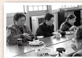
最高齢92歳のゆいっこの皆さんは、美味しそうに完食