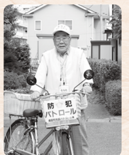
プレートを付けた自転車で日常的に見回りも