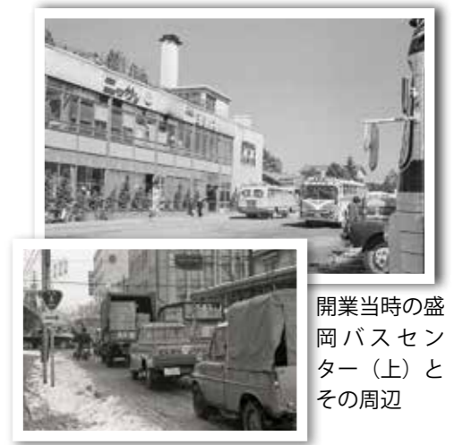
開業当時の盛岡バスセンター(上)とその周辺

た。また昭和41年には3階部分が増築され、デパートのような商業機能を備えた盛岡バスセンターは、市民をはじめ多くの利用者の憩いの場としても親しまれ、中心市街地のにぎわい創出に大きく貢献してきました。施設の老朽化などのため、運営会社により建て替えも検討されましたが、建設から57年を迎えた平成28年9月に、惜しまれながらも営業を終了し、建物は解体されました。