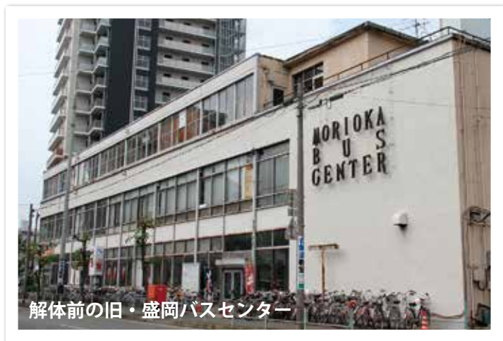
解体前の旧・盛岡バスセンター