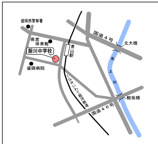
ア 盛岡市立厨川中学校（青山二丁目7-1）