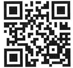
まち comi メール の QR コード