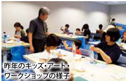
昨年のキッズ・アート・ワークショップの様子