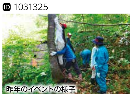
昨年のイベントの様子