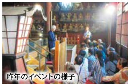
昨年のイベントの様子