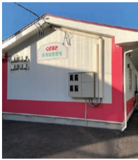
葛巻町の定住促進住宅