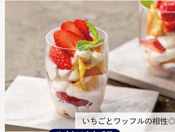
いちごとワッフルの相性◎

福岡あまおうのバブル POP かき氷 単品 …………… ¥1,000 (税込) ドリンク付 …… ¥1,200 (税込)