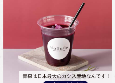
青森は日本最大のカシス産地なんです!