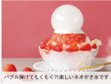
バブル弾けてもくもく?!楽しいネオかき氷です

福岡あまおうのバブル POP かき氷 単品 …………… ¥1,000 (税込) ドリンク付 …… ¥1,200 (税込)