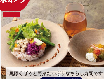
黒豚そぼろと野菜たっぷりなちらし寿司です