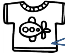
肌着用シャツ 0歳児～2歳児 1枚