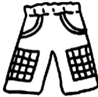
ズボン 0歳児～2歳児 1枚