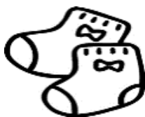
靴下 0歳児～2歳児 1足