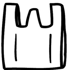
スーパー袋 (汚れたものを入れる袋) 0歳児～2歳児 2枚