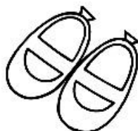
靴 (外用) 0歳児：必要に応じて使用 1歳児・2歳児：避難の時にも使いますので、玄関の靴箱には必ず置いてください。 *サンダルは不可です。