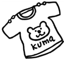
Tシャツ・トレーナーなど 0歳児～2歳児 1枚