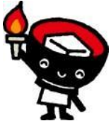
岩手県双葉県キャラクター「とふっち」