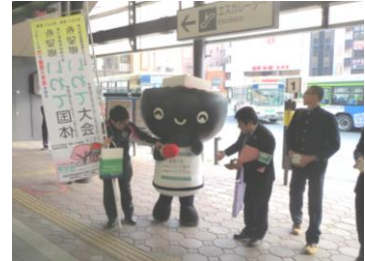
▲「とふっち」もマナーアップをアピール

今後も少年の健全育成に向けて、効果的な活動となるよう取り組んでいきたいと思えます。