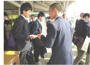
▲笑顔で活動する高校生(厨川駅)

<実施機関> : 盛岡市、滝沢市、雫石町、矢巾町、紫波町、東日本旅客鉄道株式会社、いわて銀河鉄道株式会社、日本たばこ産業株式会社、盛岡たばこ販売協同組合、盛岡市PTA連合会、盛岡地域高等学校生徒指導連絡協議会