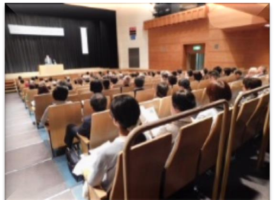
【熱心に講演を聞いている参加者】