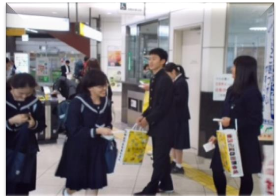
【啓発活動をしている高校生の皆さん】