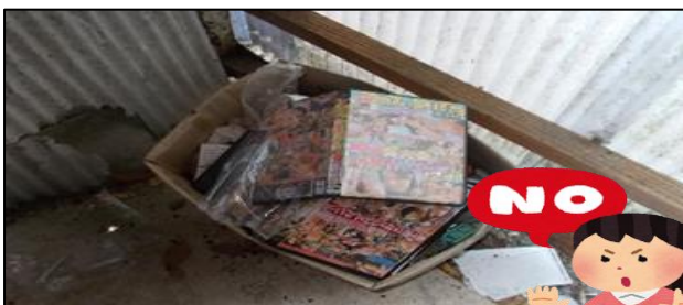
無造作に投げられた空箱