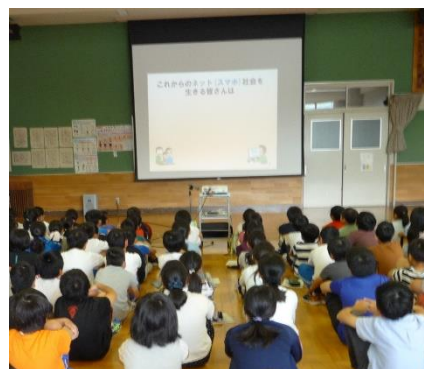
【小学校の出前講座の様子】

少年センターでは、今問題となっているスマートフォンやインターネットの利便性や落とし穴についての理解を深めていただき、少年がトラブルに遭わないことを目的に、「ネット社会に生きる子どもたちを守る出前講座」を行っています。講座は、DVDなどを活用しながら、保護者向けや、子どもたちの年齢に合わせた講座となっています。学校行事のほか、地域の行事等にも対応いたしますので、出前講座を活用してみませんか。 （申し込み先：盛岡市中央公民館 ☎019-654-5366）