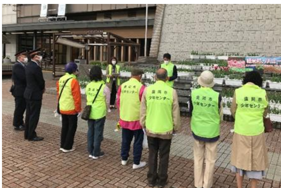
【活動前の様子（盛岡駅）】