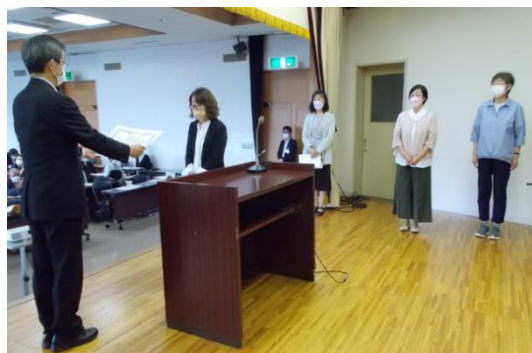
【 感謝状贈呈の様子 】