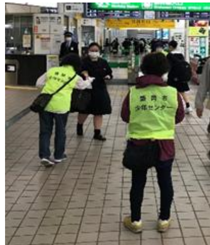
【活動中の様子（盛岡駅）】