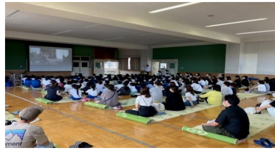
出前講座 津志田小学校