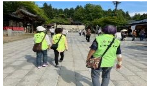
6/10 チャグチャグ馬コ特別巡回