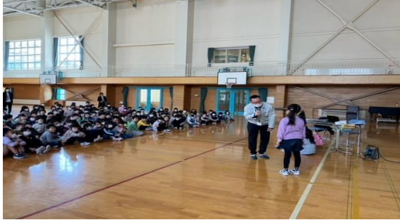
杜陵小学校不審者対応（誘拐被害防止教室）