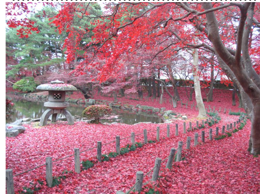
もみじのじゅうたん(昨年の様子)