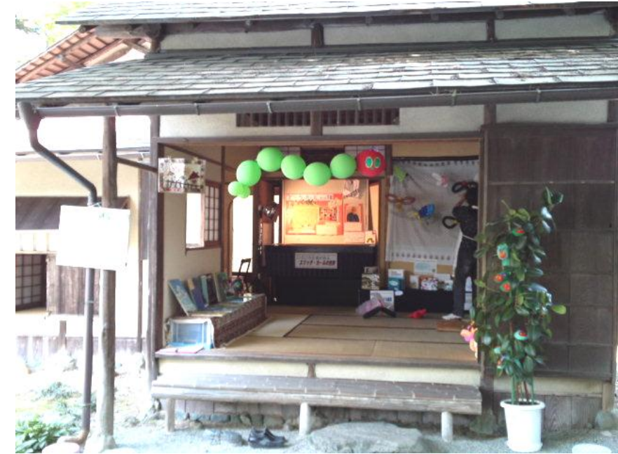
【6月の絵本サロン「エリック・カール」の世界】