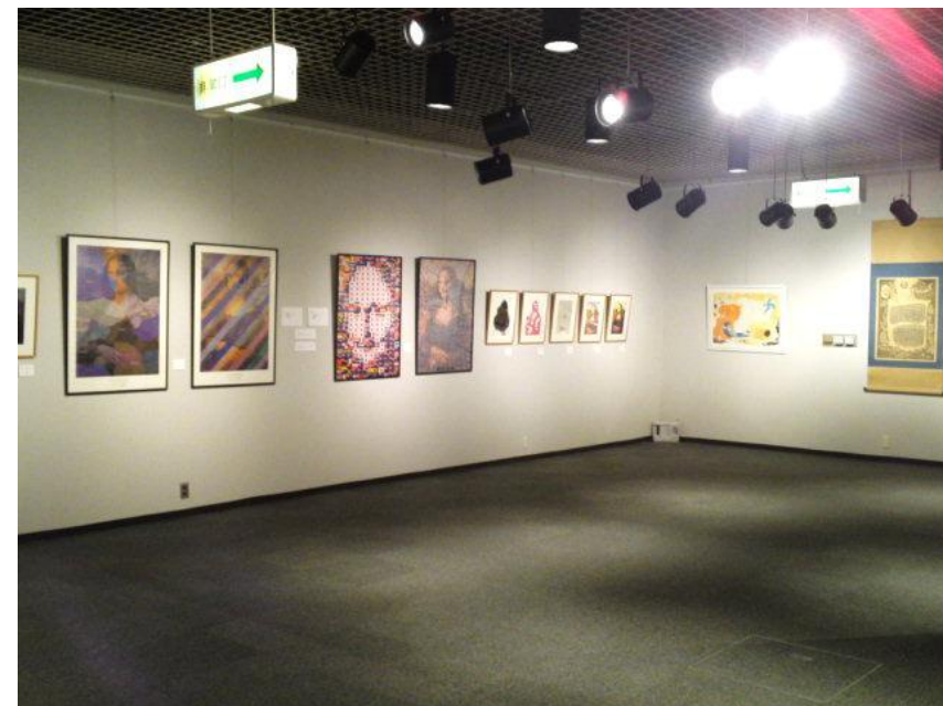
「版による表現の美」会場の様子