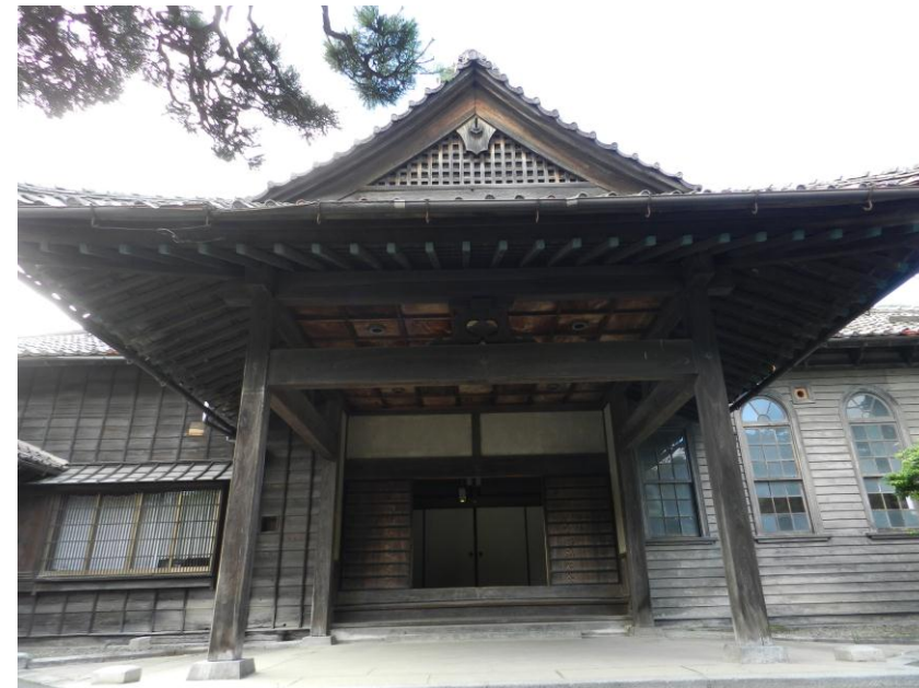
【別館 旧南部家別邸】