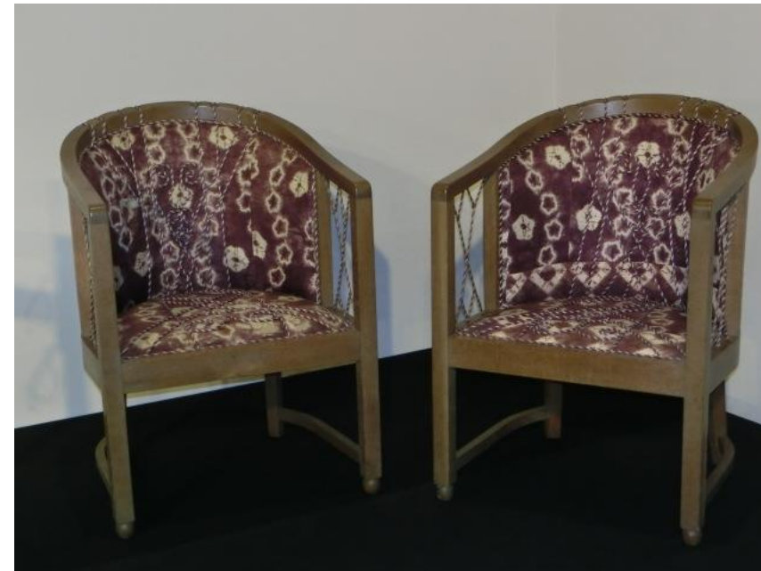
企画展「中村家と町家」で展示されている『紫根染の椅子』