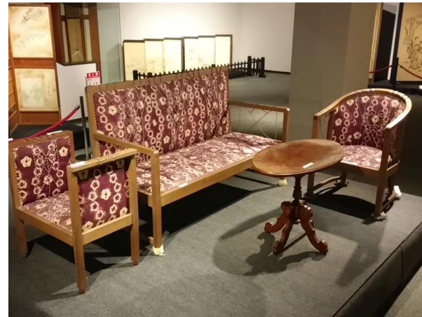
企画展「中村家を彩る“モノ”たち」の展示品