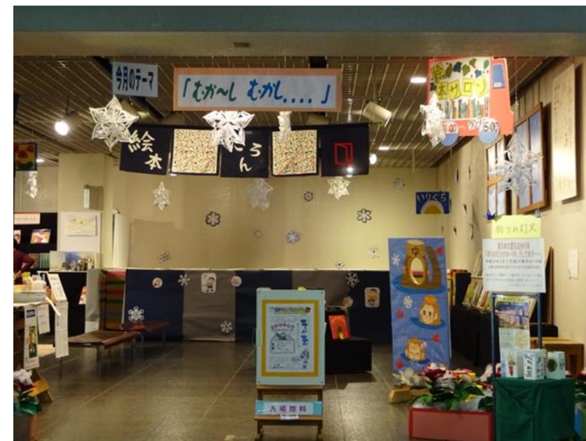
【昨年度絵本サロン】