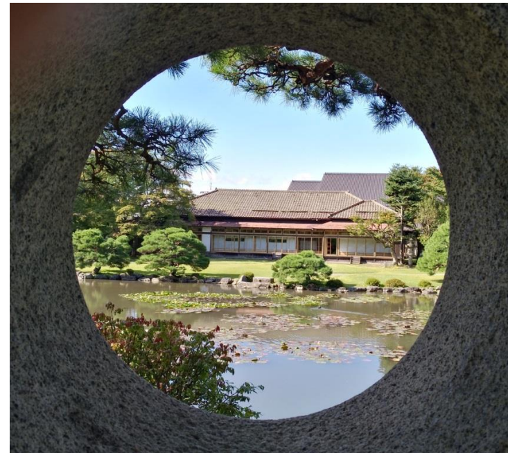
庭園から旧南部家別邸を臨む