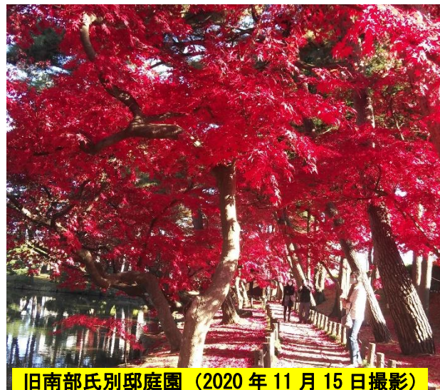
旧南部氏別邸庭園（2020年11月15日撮影）

ヤマモミジ カエデとモミジは植物分類上は同じです。カエデの中で特に紅葉の美しい種類をモミジと呼ぶ説があります。庭園のモミジの見頃は11月5～15日頃です。