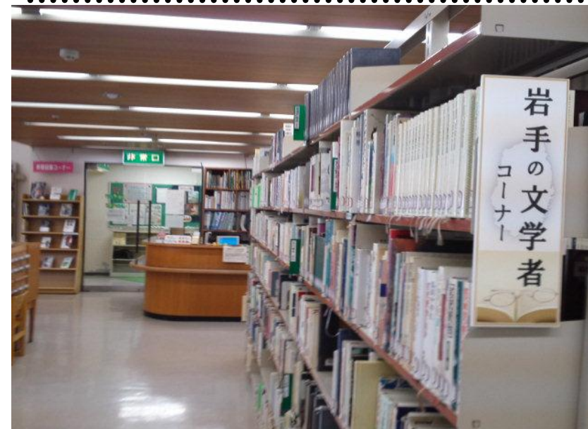
【図書室 岩手の文学者コーナー】