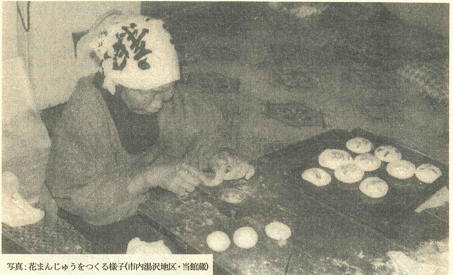
写真:花まんじゅうをつくる様子(市内湯沢地区・当館蔵)

発行 盛岡市都南歴史民俗資料館 盛岡市湯沢 1-1-38 Tel/Fax 019-638-7228