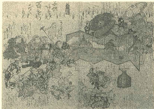
【錦絵 子供あそび百ものがたり】

錦絵「子供あそび百ものがたり」(大判二枚続)は、新政府軍と東北を中心とする諸藩とのやりとりを「百物語」という子供の遊びに見立てて風刺した江戸時代の風刺画といわれています。屏風の後から大きな椀をのぞかせている子供たちが東北諸藩、椀に驚いて逃げ回っている手前の子供たちが新政府軍です。東北諸藩に見立てられた子供たちの詞書には、「ばけものはおそろしかろふ」など強気な態度がみられ、手前には強気な子供や驚き泣いている子供がいて、庶民が当時の情勢をどのように見ていたかが分かります。このほかに、当時の風刺画とされる錦絵2点が当館に寄贈されています。