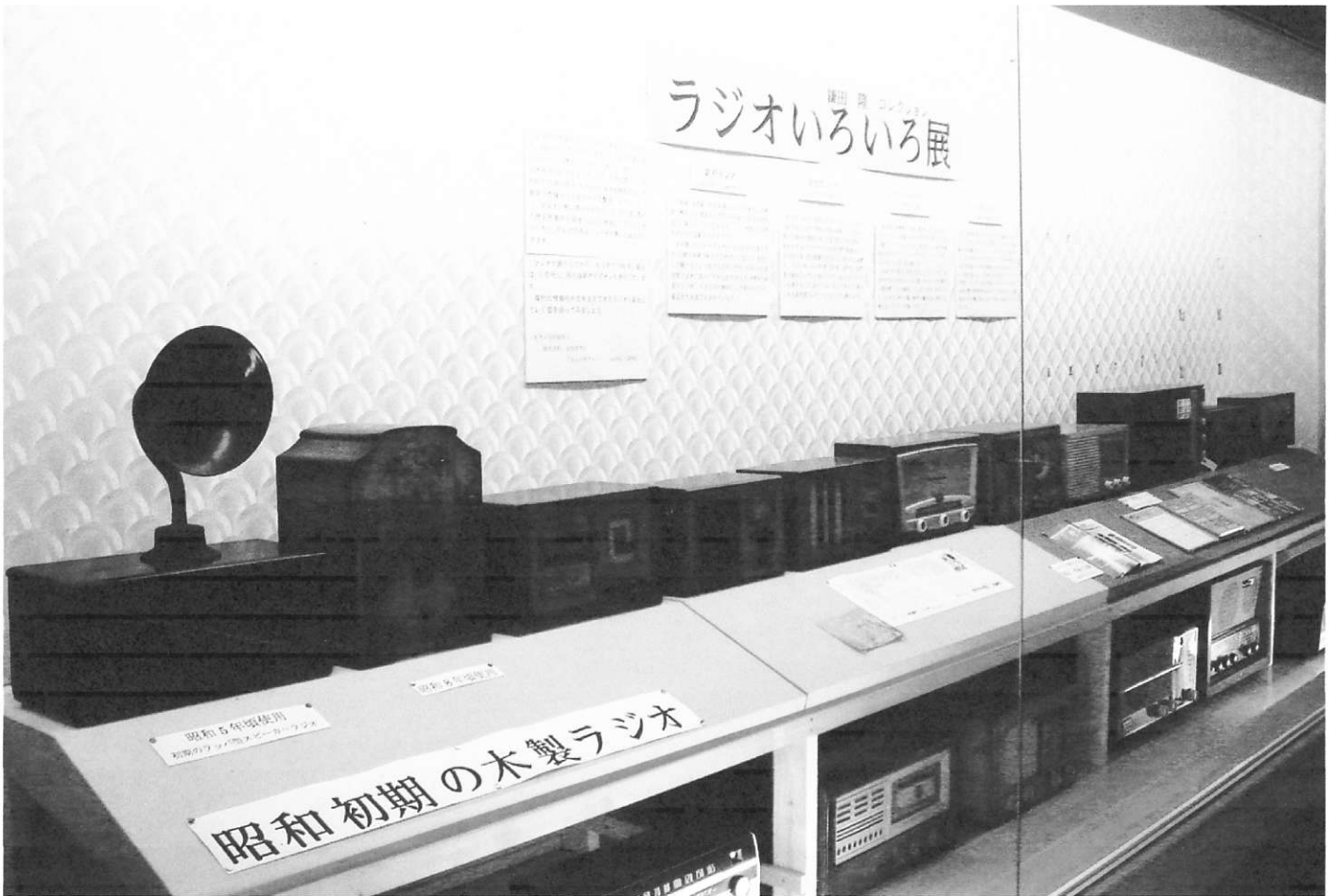
市民参加展「ラジオいろいろ展」

発行 盛岡市都南歴史民俗資料館 盛岡市湯沢 1-1-38 TEL019-638-7228