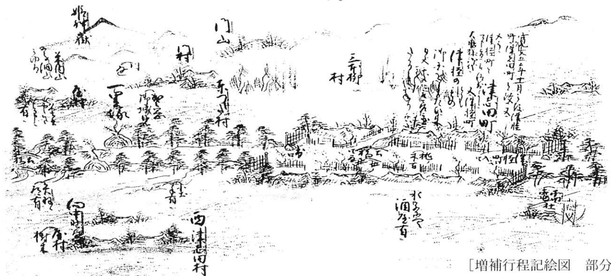
[増補行程記絵図 部分]

色々な記録から盛岡に津軽町があったのは確かです。そして津志田と津軽の関係は、今から400年前の南部家27代利直公の頃、南部の国を慕って来た人々を津軽町を設けて移住させたと伝えられていますが、津軽のどこから来た人々なのか、その子孫はどこの家か、私はその歴史と足跡を記録しておきたいと調査に当たってきましたが、不明のことも多くあります。