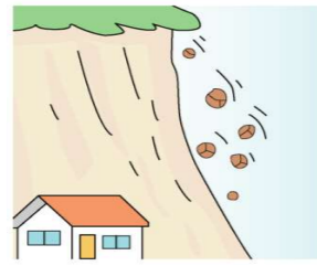
小石がパラパラ落ちる