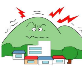
山鳴りがする腐った土の臭いがする