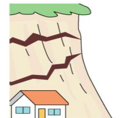
斜面に亀裂が入る根の切れるような音が出る