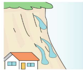
斜面から水が湧き出る