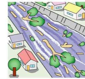
川の水が濁り流木が流れる