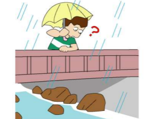
雨が降っているのに川の水が少なくなる