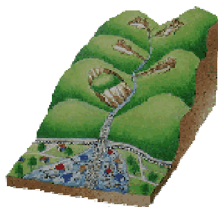
土石流による災害