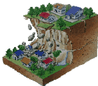
がけ崩れによる災害