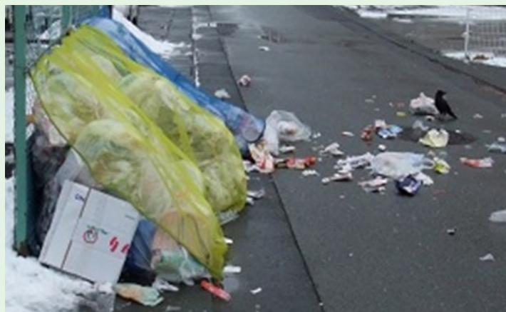
↑ ごみを漁るカラス