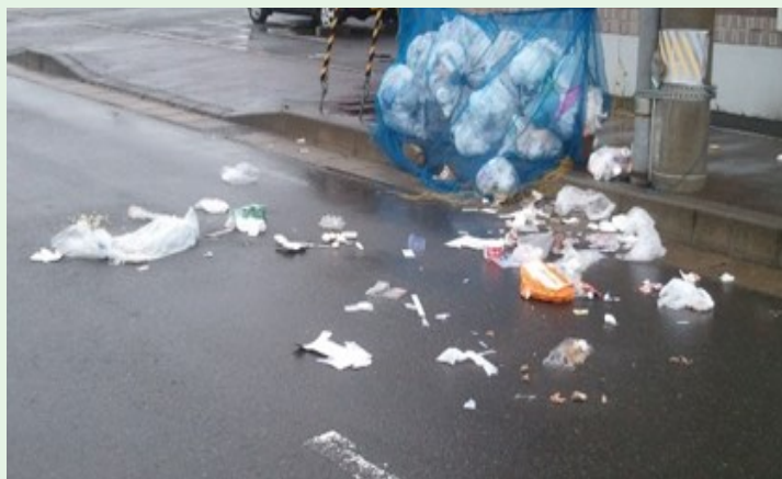
↑ 動物に荒らされたごみ集積場所