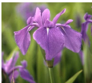
市の花「カキツバタ」