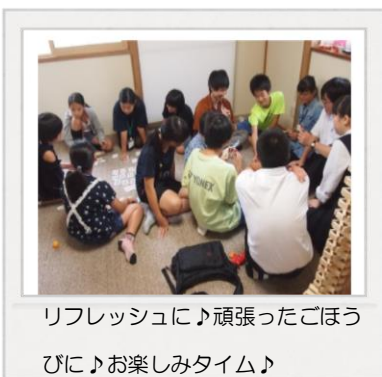
リフレッシュに♪頑張ったごほうびに♪お楽しみタイム♪