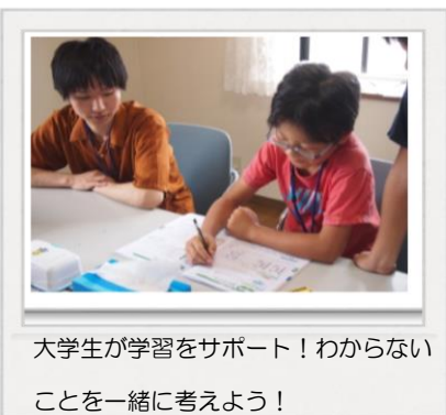
大学生が学習をサポート！わからないことを一緒に考えよう！