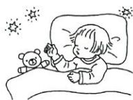
夜ぐっすり眠るためのメラトニンがよく出ます。