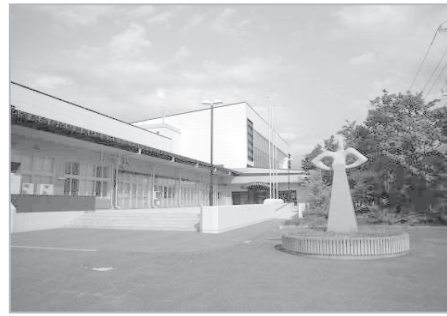
渋民運動公園総合体育館